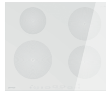
Table à induction IT 641 ORA W